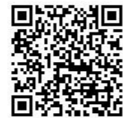
【ホームページQRコード】